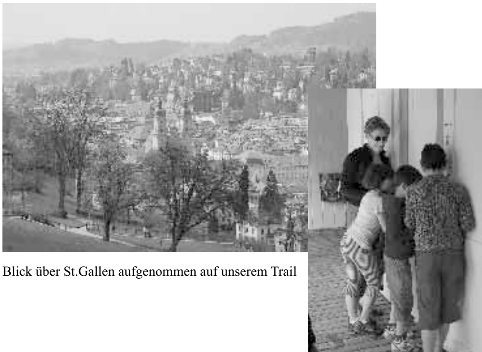
Blick über St.Gallen aufgenommen auf unserem Trail

Stimmt der Code? Öffnet sich die Tür für die neue Aufgabe?