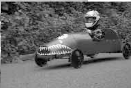
Seifenkistenrennen 2008