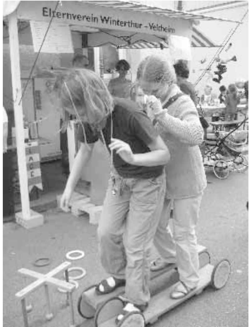
elternverein winterthur-veltheim — bulletin herbst 08

Elternverein Winterthur-Veltheim c/o Sabina Rübin Hinterwiesliweg 24 8400 Winterthur